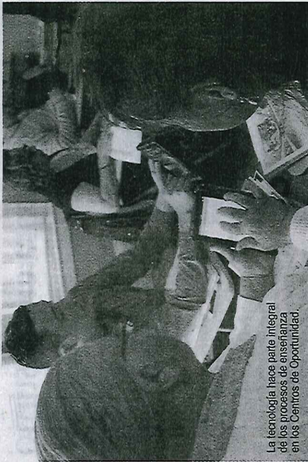
La tecnología hace parte integral de los procesos de enseñanza en los Centros de Oportunidad.